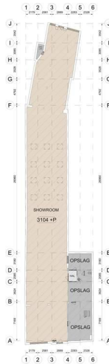
Laarstraat 54, 7201 CG, Zutphen