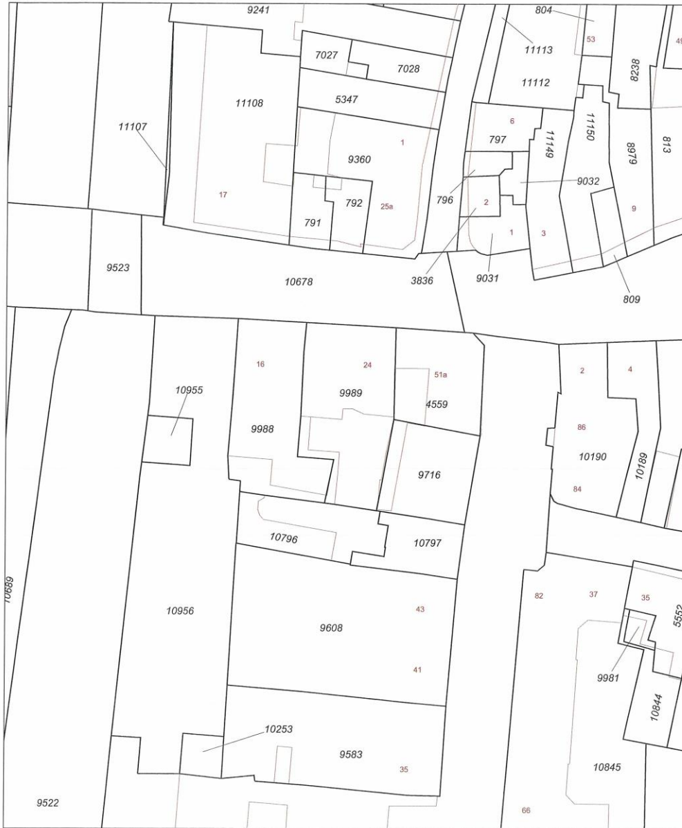
Uittreksel Kadastrale Kaart

Adres: Marspoortstraat 24 Postcode / plaats: 7201 JC Zutphen Kadastrale gemeente: ZUTPHEN Sectie: F Perceel: 9989